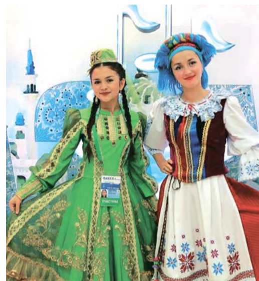
Искренняя дружба народов на «Факеле»

Мы внимательно следим за событиями и продолжаем держать за вас кулачки. С нетерпением ждем ярких и интересных кадров. Напоминаем, что проявлять креатив разрешается!