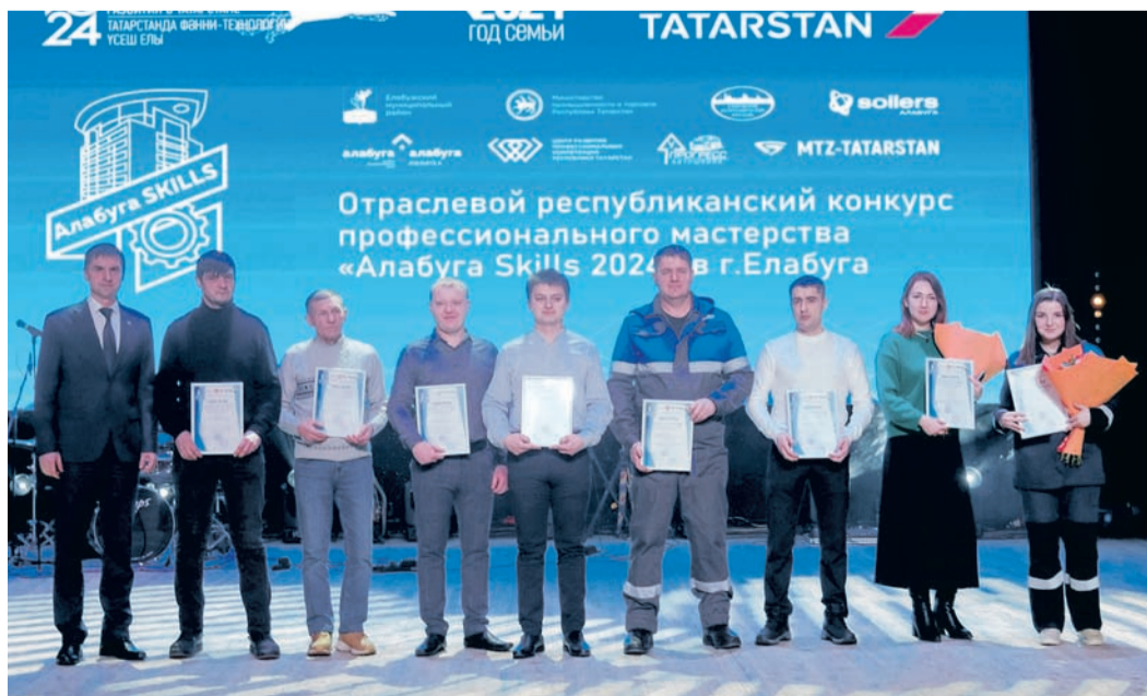
В Елабуге наградили серебряных и бронзовых призеров конкурса «Алабуга-Skills».