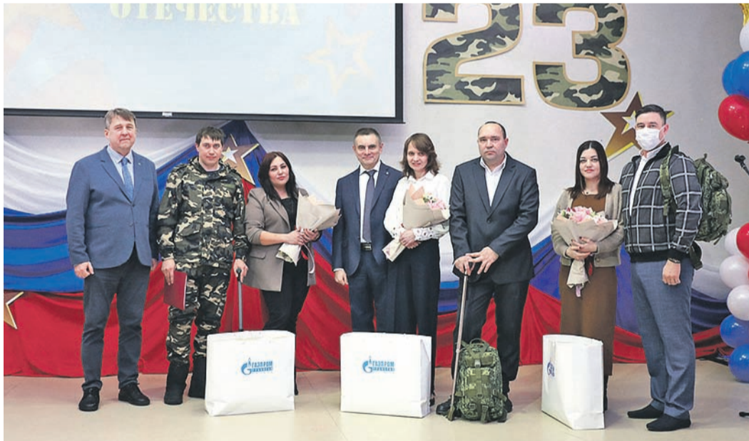
На сцене – участники и ветераны специальной военной операции со своими близкими

В преддверии Дня защитника Отечества в ООО «Газпром трансгаз Казань» прошло торжественное мероприятие в честь ветеранов, участников боевых действий и специальной военной операции, воинов-интернационалистов.