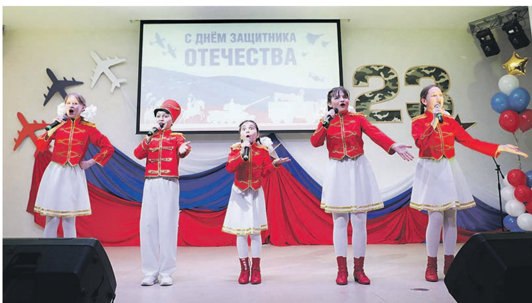
Музыкальными номерами гостей порадовали дети работников «Газпром трансгаз Казань»