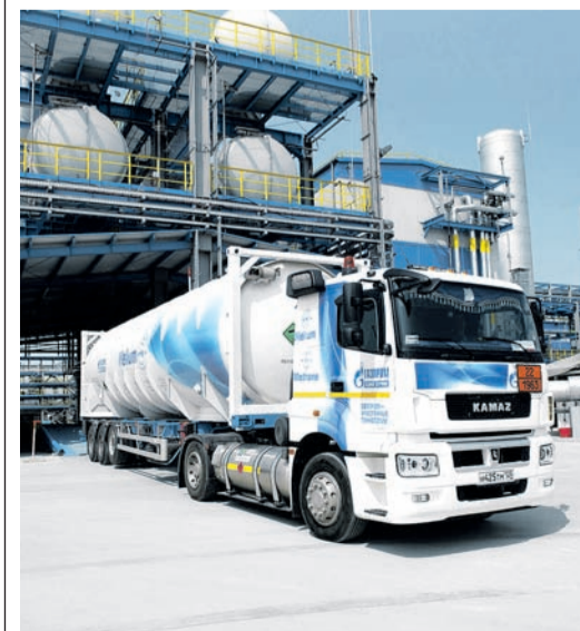
Амурский ГПЗ – крупнейший в мире производитель гелия

В интересах дальнейшего развития российской гелиевой промышленности Газпром активно взаимодействует с отечественными предприятиями и научными институтами. Так, в настоящее время компания привлекла ряд производителей к организации серийного производства изотермических контейнеров.