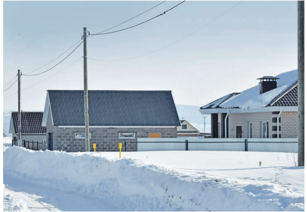
Новый микрорайон, построенный в селе Борок Нижнекамского района республики

«По случаю большого праздника хотел бы выразить благодарность строителям, которые в намеченные сроки с высоким качеством построили мощный объект, обеспечив большую перспективу развития села. Также поздравляю счастливых потребителей голубого топлива. Когда в доме есть газ, значит,