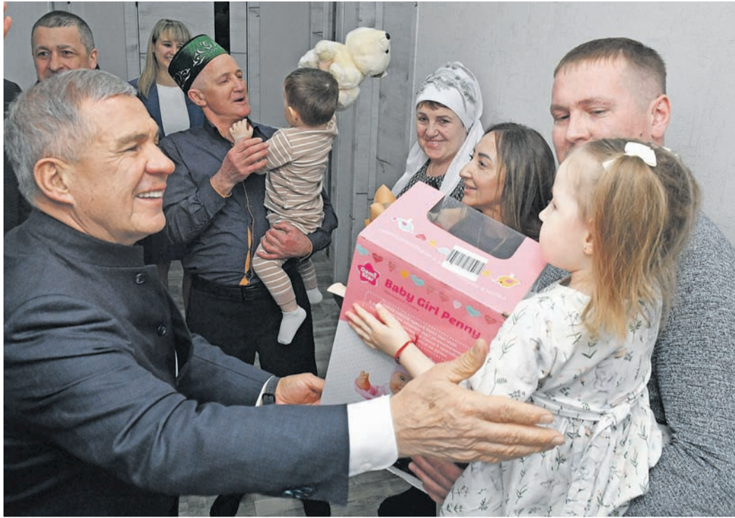
Глава Татарстана Рустам Минниханов побывал в гостях у одной из многодетных семей