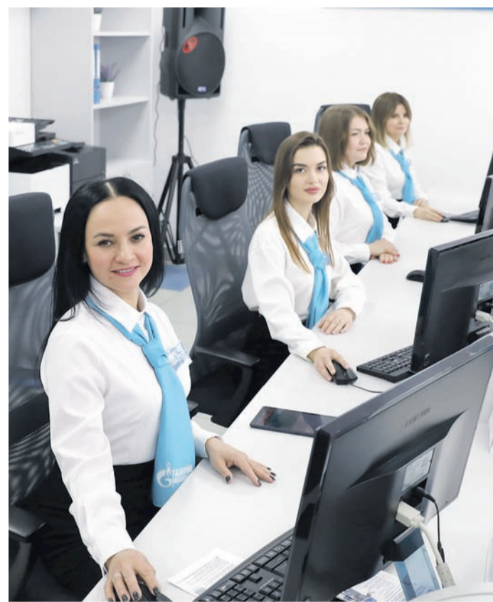
Очаровательные сотрудницы центра встречают первых посетителей

В своем выступлении Руслан Фатхлисламов отметил: «Сегодня 40 процентов всех наших потребителей уже пользуются современными центрами обслуживания, которые сложно представить без тех цифровых решений, которые мы также успешно реализуем. Это платформа по взаимодействию с абонентами ПРИВА, значительно упростившая и ускорившая обслуживание. Здесь есть возможность интерактивно оплачивать услуги, передавать показания, в онлайн-режиме