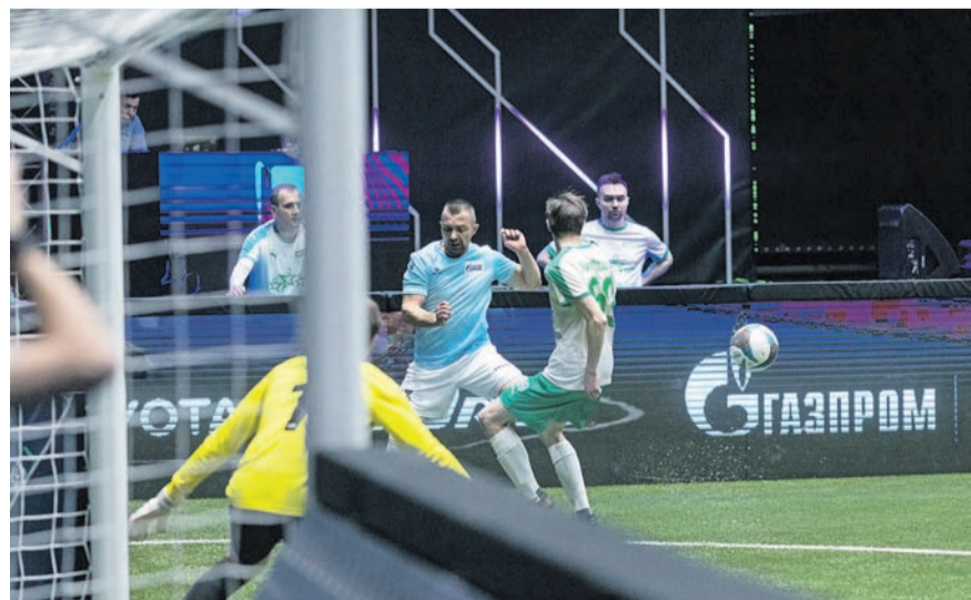
Спортсмены впечатлили болельщиков яркими эмоциями во время матча