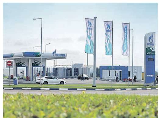
Автомобильная газонаполнительная компрессорная станция, построенная в РТ по программе использования природного газа в качестве моторного топлива

В октябре 2022 года в рамках международного форума «Российская энергетическая неделя» стороны подписали программу развития газоснабжения и газификации Татарстана до конца 2025 года.