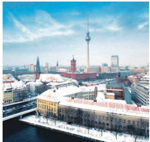
Болеe пятидесяти лет Россия является надёжным поставщиком природного газа в Европу

Значительную роль в обеспечении надёжных поставок российского газа в Европу играют современные морские газопроводы «Северный поток» и «Турецкий поток». Поэтому особенно важно, что с 29 декабря прошлого года полностью готов к работе ещё один морской газопровод – «Северный поток – 2» с проектной мощностью 55 млрд кубов газа в год.