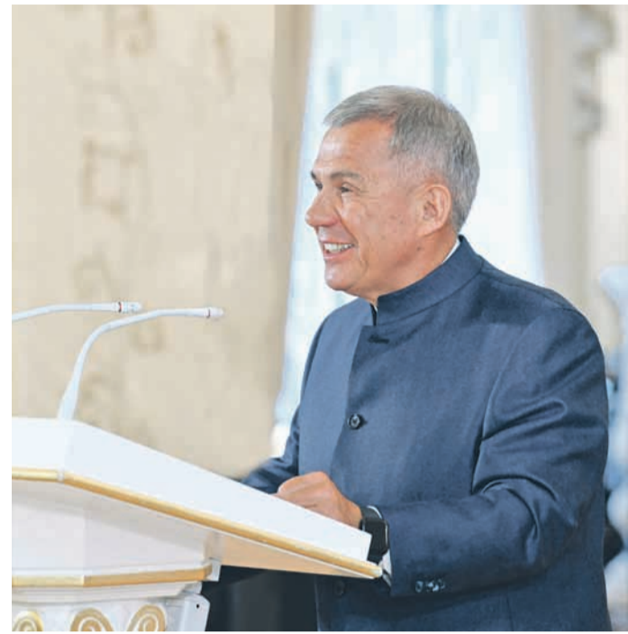
Глава республики тепло поздравил чемпионов

В Казанском Кремле 12 января Президент Татарстана Рустам Минниханов чествовал мужскую волейбольную команду «Зенит-Казань», в десятый раз завоевавшую Кубок России, и женский клуб «Динамо – Ак Барс», для которого эта победа стала седьмой.