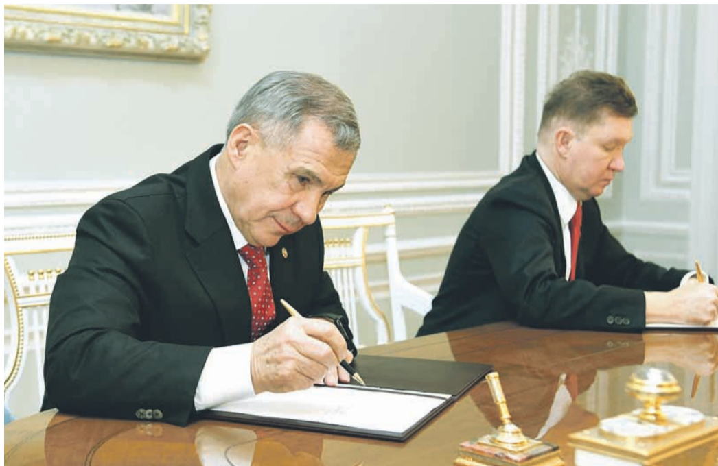
Рустам Минниханов и Алексей Миллер подписали соглашение о сотрудничестве между Татарстаном и ПАО «Газпром»

В 2013 году в республике насчитывалось около 500 транспортных средств, использующих природный газ в качестве моторного топлива, на сегодня парк техники на КПП превышает 11 тысяч единиц. Существенную долю среди газомоторной техники составляют пассажирские автобусы. Наиболее успешный опыт экс-