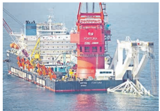
Укладка газопровода «Северный поток – 2» в территориальных водах Германии

По итогам 2021 года ожидается максимальный за всю историю Газпрома финансовый результат. А это значит, что дивиденды также будут абсолютно рекордными – причём как для Газпрома, так и среди всех российских публичных компаний.