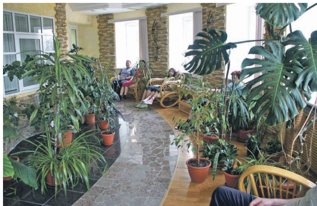
Зимний сад – комната релаксации позволяет быть всегда в тонусе, помогает снять напряжение и расслабиться

В 2019 году «Газовик» был удостоен звания «Лучший санаторий Республики Татарстан», а в 2020-м вошёл в число ста легендарных брендов РТ. Год 2021-й наград не принёс – отмеченный карантин, когда здравница работала с половинной загрузкой, приняв только 3 780 отдыхающих, он стал испытанием её на прочность. Нынче санаторию «лимит» увеличен до 75-процентной загрузки. А в мае текущего года руководство «Газовика» намерено выставить на суд строгого жюри всероссийского форума «Здравница-22» свой санаторий сразу в нескольких номинациях – «Лучший санаторий», «Лучший лечебно-оздоровительный комплекс» и как ведомственную здравницу.