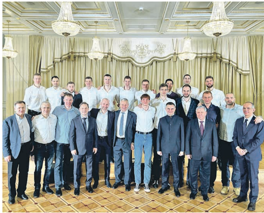
Волейбольная команда «Зенит-Казань» в десятый раз завоевала Кубок России