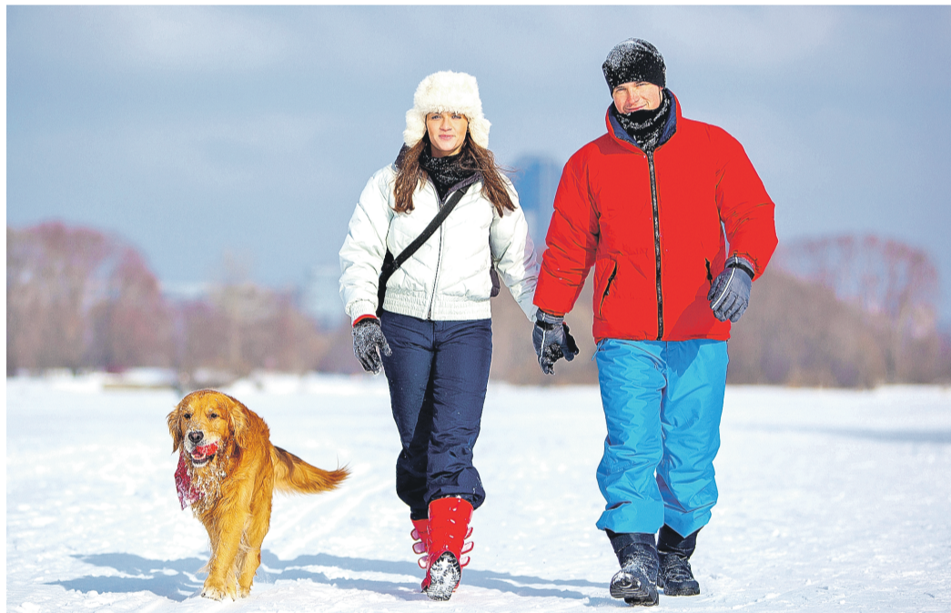
Самая приятная реабилитация – прогулки на свежем воздухе

Основной орган поражения ковидом – лёгкие. Нужно знать: вирусное воспаление всегда отражается на обоих лёгких. Одностороннее поражение – бактериальное, которое может лишь присоединиться к вирусному только в виде осложнения. Бронхит в таком случае