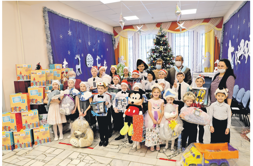
Желания исполняются под Новый год

Работники Общества ежегодно проявляют большую активность, никто не остаётся равнодушным. Сотрудники принимают участие в благотворительной акции «Ёлка желаний». В хосписе сегодня 218 детей, на лечении в онкогематологическом отделении ДРКБ – около шестидесяти мальчишек и девчонок, двадцать пять маленьких воспитанников в социальном приюте «Шатлык», по тридцать два ребёнка – в Нурлатском и Лаишевском детских домах и сорок один воспитанник 11-й казанской школы-интерната. Все они получают подарки и искорку тепла в канун Нового года и наверняка попросят Деда Мороза в эту сказочную ночь исполнить самую главную свою мечту – выздороветь, увидеть маму и папу – добрых и красивых, снова оказаться дома... И эти мечты нам тоже придётся выполнять, иначе какие же мы волшебники, если не можем помочь своим детям?