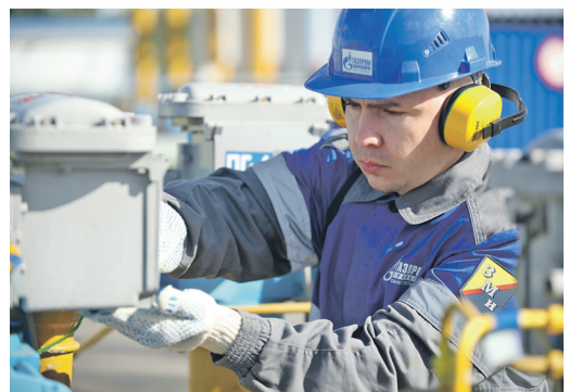
Растут поставки газа в Китай по газопроводу «Сила Сибири»

По данным Gas Infrastructure Europe, к началу ноября разница в заполненности европейских подземных газовых хранилищ по сравнению с прошлым годом – минус 18,2 млрд кубометров. Запасы газа в ПХГ Украины на 10,1 млрд кубов меньше уровня 2020 года.