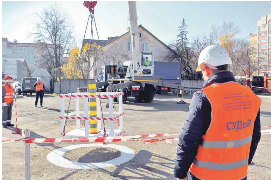
В практической части состязания были разработаны особые упражнения на время и точность исполнения профессиональных навыков

Конкурс состоял из теоретической и практической частей. Для водителей, экскаваторщиков и крановщиков были разработаны особые упражнения на время и точность исполнения профессиональных навыков. Затем их ждала тестовая проверка на знание правил дорожного движения по дей-