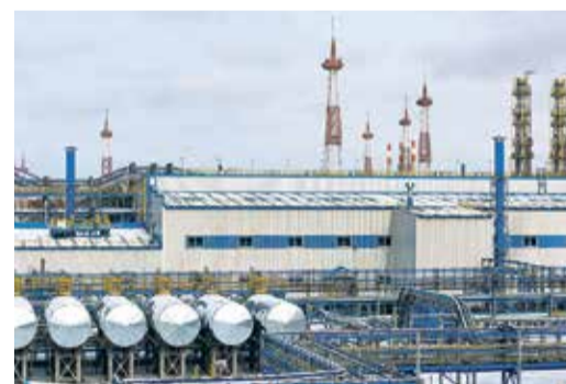
На Чаяндинском месторождении идут пусконаладочные работы

«Сила Сибири» – крупнейшая система транспортировки газа на востоке России будет транспортировать газ Иркутского и Якутского центров газодобычи российским потребителям на Дальнем Востоке и в Китай. В настоящее время на основных объектах обустройства Чаяндинского месторождения идут пусконаладочные работы, с опережением графика ведётся бурение эксплуатационных скважин. На Ковыктинском месторождении в Иркутской области, газ которого поступит в «Силу Сибири» в начале 2023 года, полным ходом идёт эксплуатационное бурение.