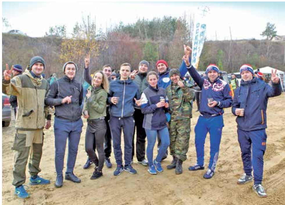
По общекомандным результатам триал-турнира в кластере «Казань» победила команда «синих»