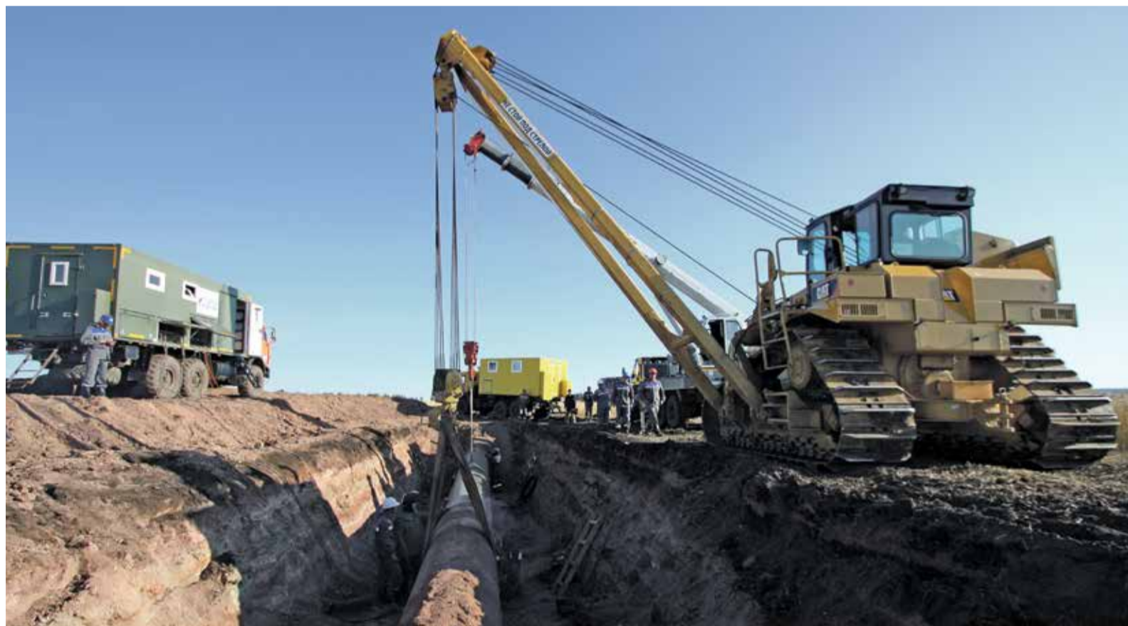
Работники Альметьевского ЛПУМГ успешно справились с задачей по подготовке магистральных газопроводов к эксплуатации в осенне-зимний период 2019 – 2020 годов

К концу октября ООО «Газпром трансгаз Казань» полностью завершило работы по подготовке объектов к эксплуатации в осенне-зимний период 2019 – 2020 годов.