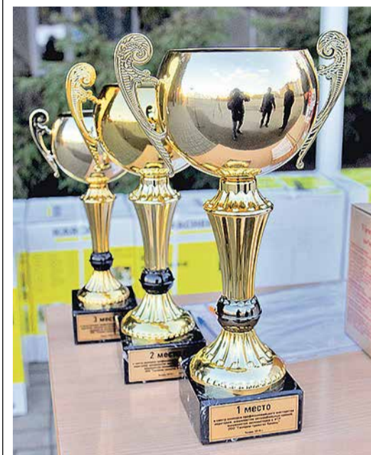
Трофеи конкурса профмастерства