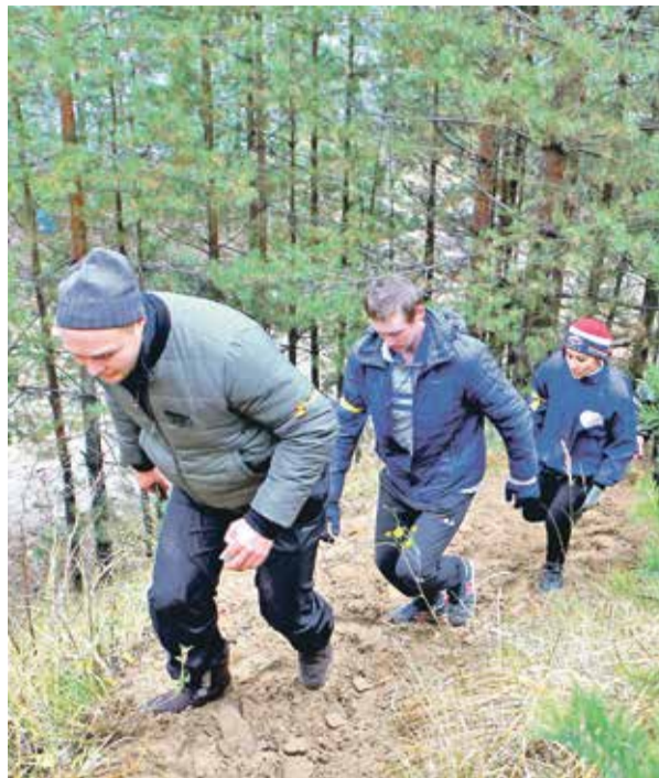
Маршрут предполагал умение ориентироваться при помощи приложения Google Maps

В конце октября состоялись соревнования казанского кластера триал-турнира «Осенний рейд». В 2019 году местом проведения ежегодного спортивного форума стали окрестности озера Изумрудного, что находится в Кировском районе Казани.