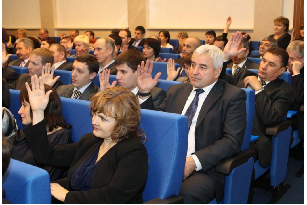
Коллективный договор единодушно утвержден на конференции трудового коллектива