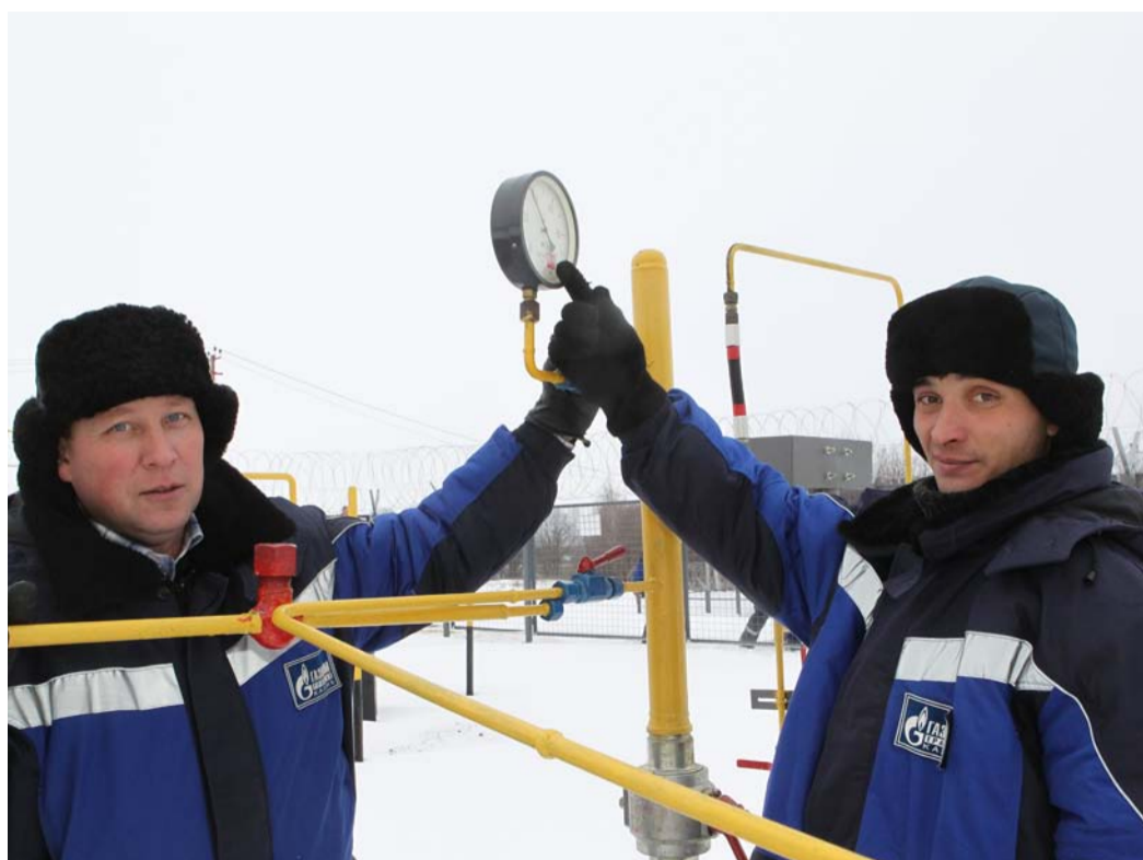
Газовики констатируют - давление в норме

В завершение церемонии, в которой также приняли участие вице-премьер-министр промышленности и торговли Равиль Зарипов и мэр Казани Ильсур Метшин, отличившимся строителям и газовикам были вручены государственные и корпоративные награды. А Рустаму Минниханову генеральный директор общества «Газпром трансгаз Казань» Рафкат