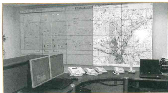
Рис. 2. Видеостена и АРМ диспетчера, отображающие видеоклады СОДУ

[3, 4] производства АО «АТГС», предназначенный для непрерывного автоматизированного контроля и управления технологическими и производственными процессами, а также предоставления диспетчерскому и производственному персоналу предметно- и объектно-ориентированной информации для принятия эффективных, своевременных и обоснованных решений по управлению этими процессами.