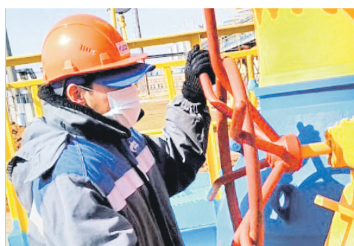
НА ПОСТУ В ЛЮБОЙ СИТУАЦИИ Мы трудимся, чтобы вам было тепло дома Стр.4