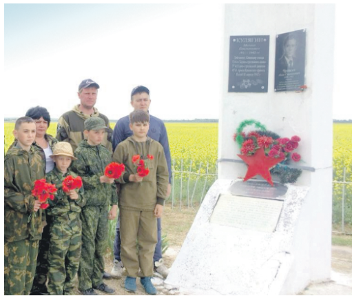
Лично причастны к Победе

С 2015 года ПАО «Газпром» в целях сохранения памяти о героях Великой Отечественной войны, развития поискового движения России проводит военно-патриотическую акцию «Вахта памяти», участие в которой принимают молодые специалисты дочерних обществ ПАО «Газпром».