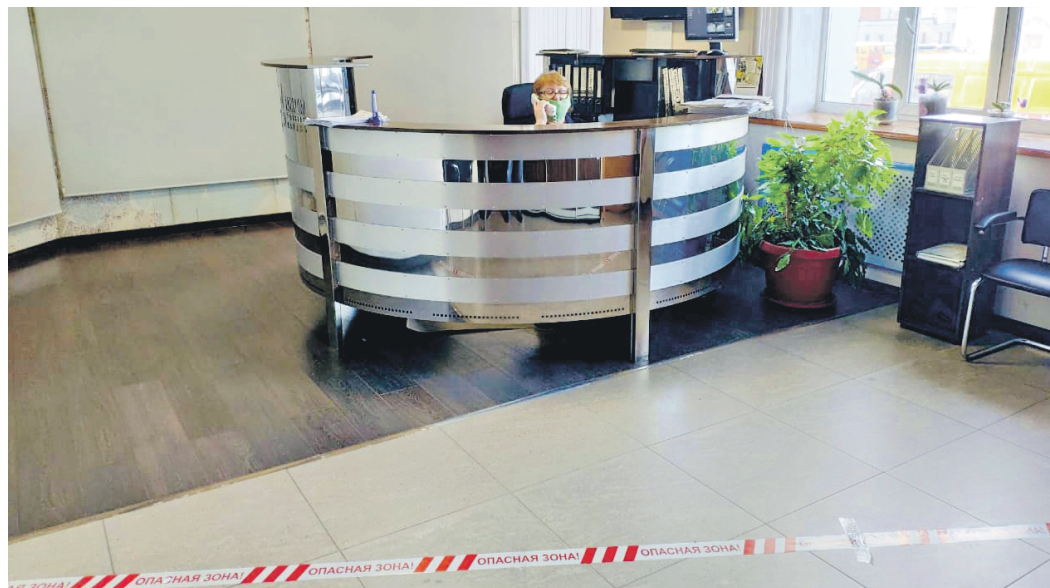
Сердце ЭПУ «Казаньгоргаз» – диспетчерская, работает без перебоев

«Мы работаем, чтобы вам было тепло дома. Оставайтесь дома!» – под таким лозунгом трудится коллектив ООО «Газпром трансгаз Казань».