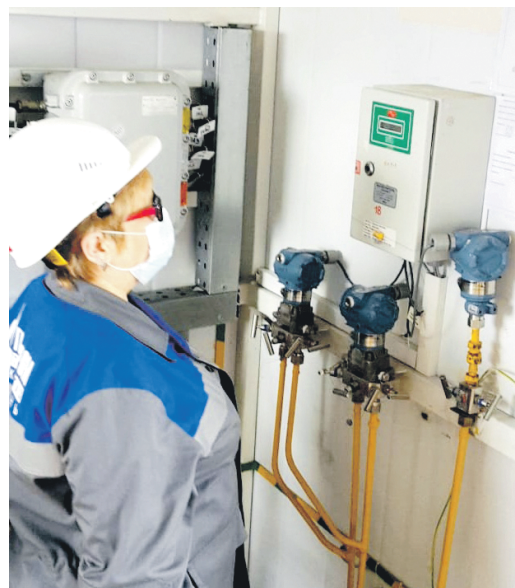
Альметьевское ЛПУМГ – оператор ГРС «Тихоновская» выполняет проверку и корректировку расхода одоранта