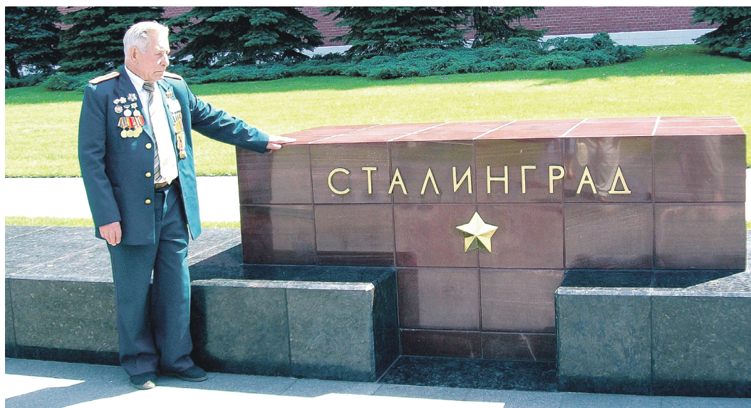
Столько лет прошло, а память хранит имена и лица боевых товарищей