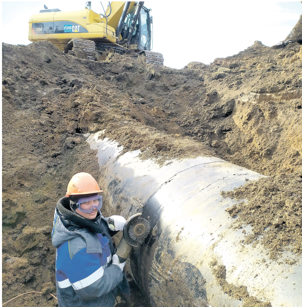
Фрагмент трубы нужно аккуратно вырезать и заменить новым

Откуда берутся дефекты труб? Причин великое множество. К примеру, рост количества аномалий может быть обусловлен наличием дефектов с начала строительства – непровар кольцевого шва, некачественная изоляция и другие.