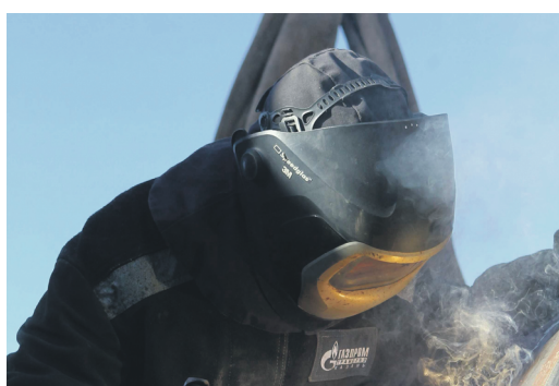
БУДНИ Весенне-летние работы набирают обороты Стр.4