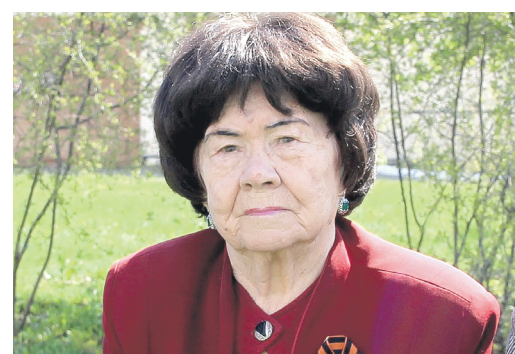
НАВСТРЕЧУ 75-Й ГОДОВЩИНЕ ПОБЕДЫ Время, которое никогда не забудется Стр.5