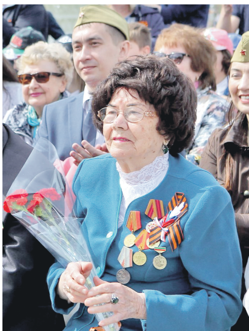
День Победы – особый праздник

22 июня 1941 года по радио объявили о том, что началась Великая Отечественная война. Летом 1941-го мы работали в поле. В колхозе тогда всё вручную делали: и пололи, и жали, и сено косили. Запасали корм для скота на зиму. Трактористов забрали на фронт, поэтому девушки стали учиться управлять трактором. Моя старшая сестра выучилась на тракториста и работала в поле. Первые годы войны были очень трудные. Все мужчины ушли на фронт, и мы не успевали убирать урожай. Женщины и дети постарше работали много, до глубокой ночи. Весь урожай отдавали фронту. Спасало только то, что у каждой се-