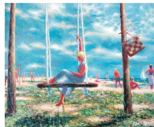
«На качелях». Холст, масло. 2004 год