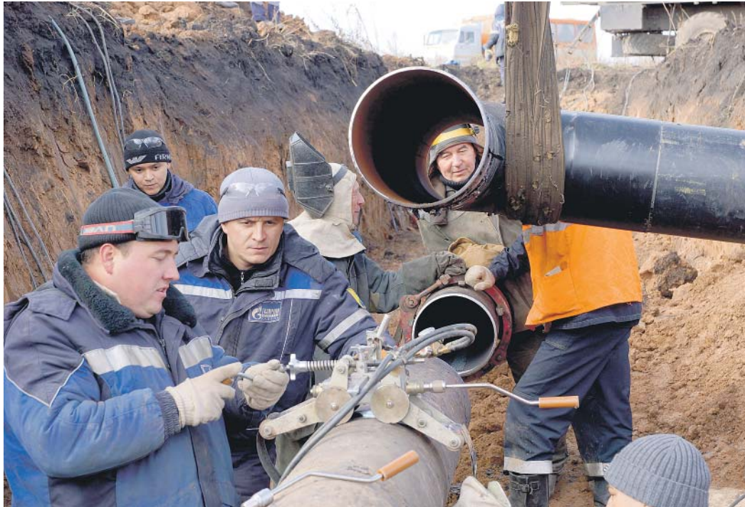
Ведутся работы по газоснабжению IT-города Иннополиса в Верхнеуслонском районе Татарстана

работ является магистральный этанопровод Миннибаево – Казань, осуществляющий транспорт этановой фракции от ООО «Газпром добыча Оренбург» и ОАО «Татнефть» на одно из крупнейших химических предприятий России – «Казаньоргсинтез». Этот трубопровод протяженностью 292 километра был введен в эксплуатацию в 1973 году. За годы эксплуатации в связи с невозможностью приостановки технологического процесса в «Казаньоргсинтезе» и других технических причин ремонтные работы и внутритрубная дефектоскопия проводились не в полном объеме.