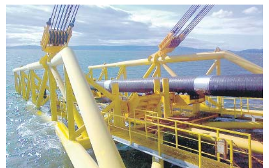
В болгарском порту Бургас начнется возведение глубоководной магистрали

Напомним: «Южный поток» – глобальный инфраструктурный проект Газпрома по строительству газопровода мощностью 63 млрд кубометров через Черное море в страны Южной и Центральной Европы в целях диверсификации маршрутов экспорта природного газа и исключения транзитных рисков. На полную мощность газопровод выйдет в 2018 году.