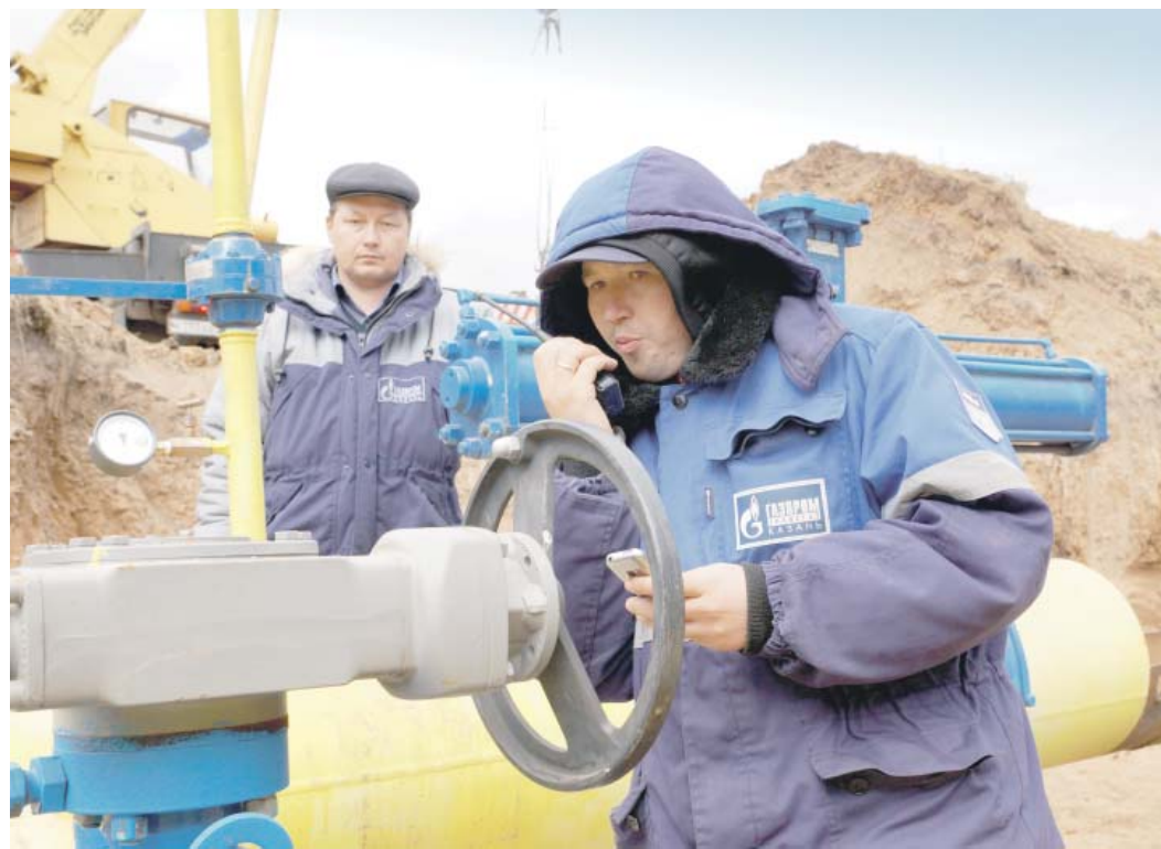
Наиболее сложный процесс при подготовке газового хозяйства республики к зимнему сезону – диагностика магистрального этанопровода Миннибаево – Казань