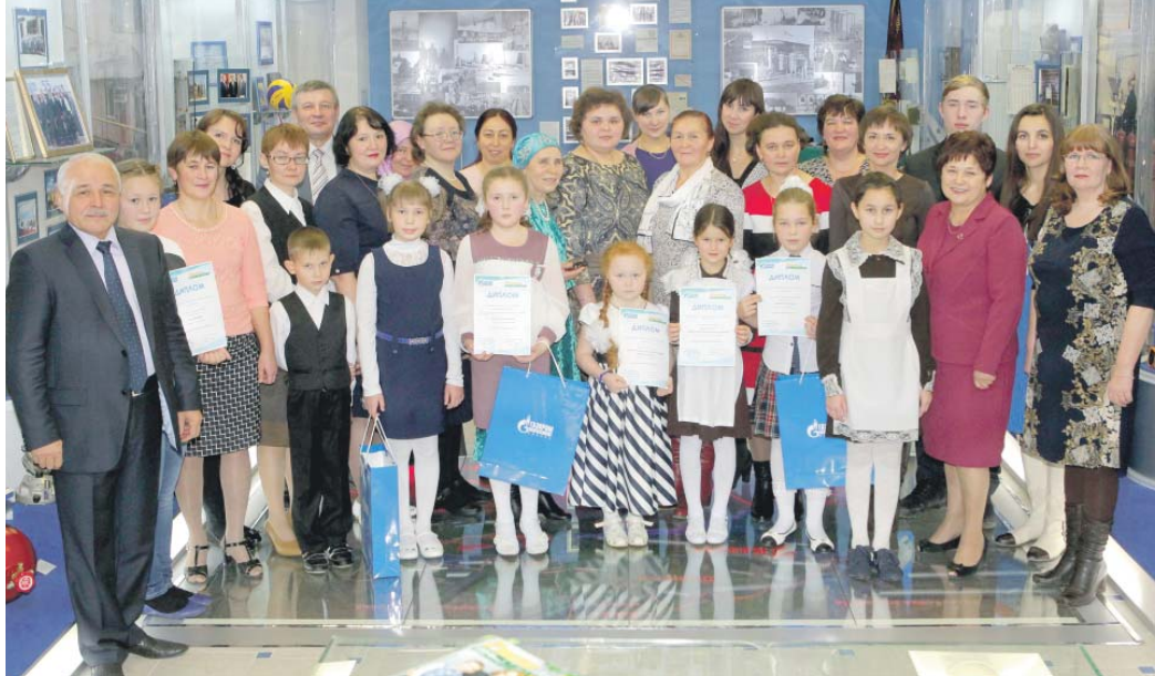
Победители конкурса после награждения сфотографировались на память с организаторами этого мероприятия

На конкурс-викторину, который проводился с июня до октября, поступили работы от более пятидесяти участников из двенадцати районов республики и одна – из Кировской области. Причем ребята присылали в «Газпром трансгаз Казань» не только индивидуальные творения, но и коллективные – выполненные целыми группами из детских садов, кружков, летних оздоровительных лагерей. Мальчишки и девчонки творчески подошли к ответам на вопросы – сопровождали свои материалы стихами, рисунками, даже карикатурами. Итоги «газового» состязания, как сообщила началь-