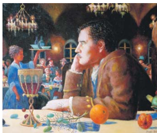
«Посторонний. Автопортрет». Холст на картоне, масло. 2013 год