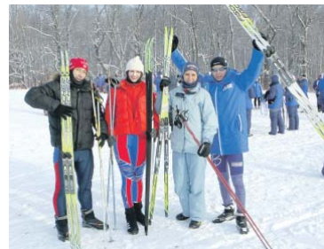
В эстафете уверенно победила команда ЭПУ «Казаньгоргаз»