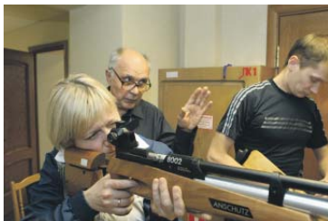
Соревнования по стрельбе из пневматической винтовки