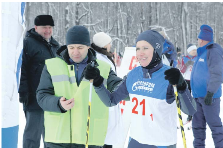
Лыжные гонки проходили на трассе, оборудованной на опушке живописного леса