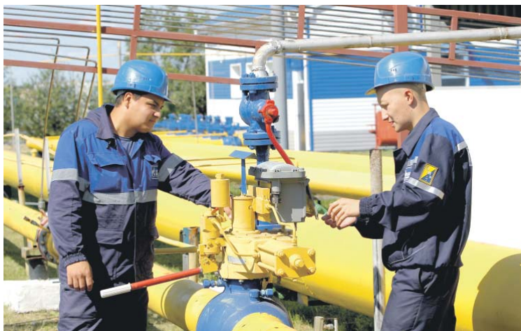
Руководство Общества уделяет большое внимание созданию своим работникам хороших условий труда, обеспечению их современными средствами индивидуальной защиты и спецодеждой

Система управления охраной труда ОАО «Газпром» устанавливает единые требования к организации безопасности труда в дочерних организациях и регламентирует порядок управления охраной труда и промышленной безопасностью. Эта вертикально интегрированная система, сложившаяся в течение многих лет под влиянием специфики отрасли.