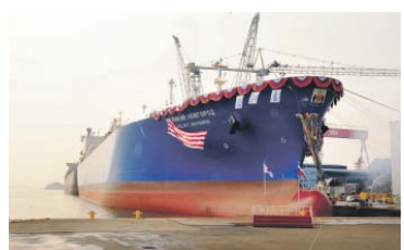
Газозов «Великий Новгород»

«Мы формируем собственный танкерный флот, готовый обеспечить транспорт СПГ в любую точку мира, в том числе по Северному морскому пути. Танкеры «Великий Новгород» и «Псков» дают возможность Газпрому серьезно увеличить объем торговых операций и усилить свои позиции на глобальном рынке сжиженного природного газа», – сказал Александр Медведев.